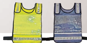
蛍光イエロー ネイビーブルー