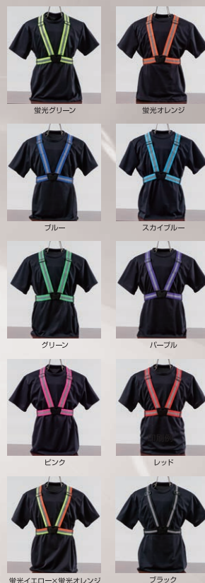
蛍光イエロー×蛍光オレンジ